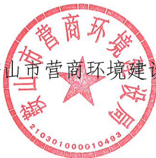
鞍山市营商环境建设局