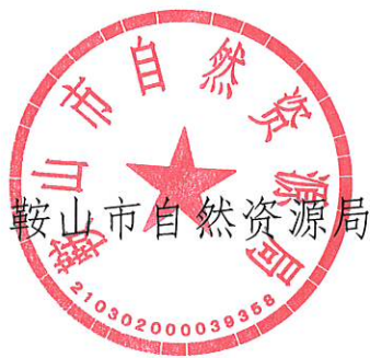
鞍山市自然资源局

附件:《关于印发<高效推进商品房不动产转移登记(新建商品房)“一件事”工作方案>的通知》-正文