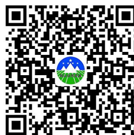
违规禁办事项清单