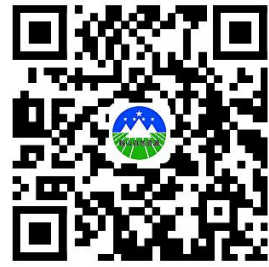
容缺办理事项清单