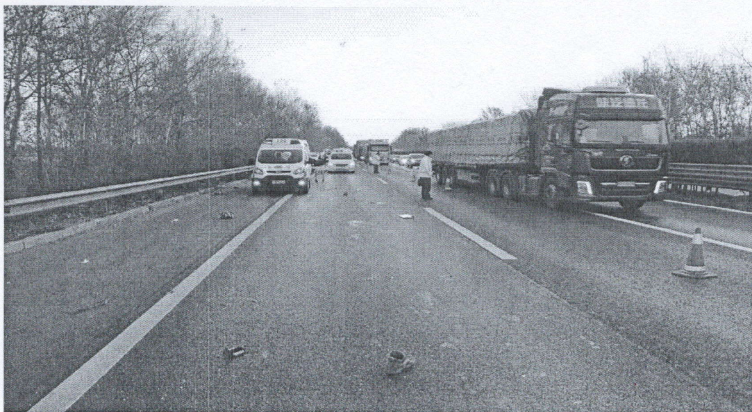
图 1 现场图片

120 等救援力量第一时间赶赴现场开展救援救治和事故处理工作。省公安厅交管总队、市公安局领导先后赶赴事故现场，指导现场救援救治等处置工作，至 8 时许，道路恢复交通。