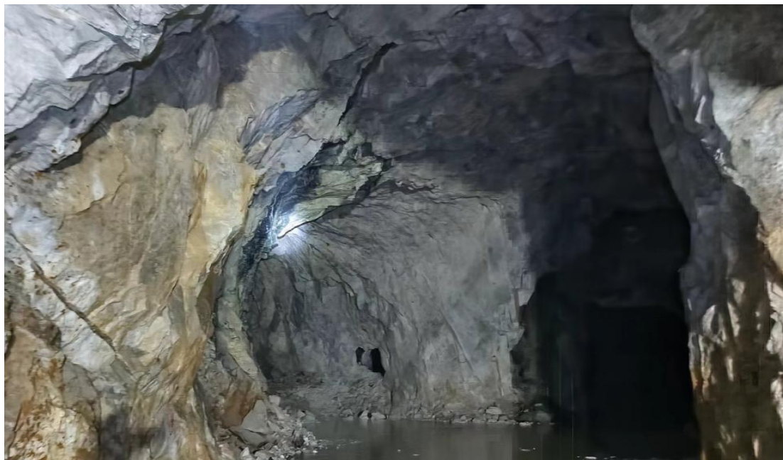
事发巷道宽约 9m，险石在巷道顶部与侧面交接处，落差约 4.5m，最大岩石块约 25kg。

Topographic map of the study area showing elevation contours and specific points. The map includes labels for '事故位置' (Accident Location) and various elevation points such as '顶高' (Peak Elevation) and numerical values like 165.31, 170.13, 165.27, etc.