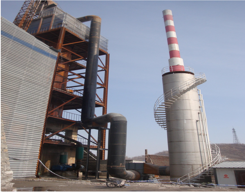
图二：炉窑及脱硫除尘塔