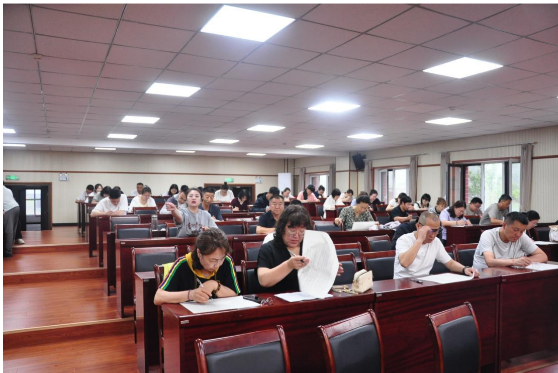
图 32 教师“七一”知识竞赛答题现场