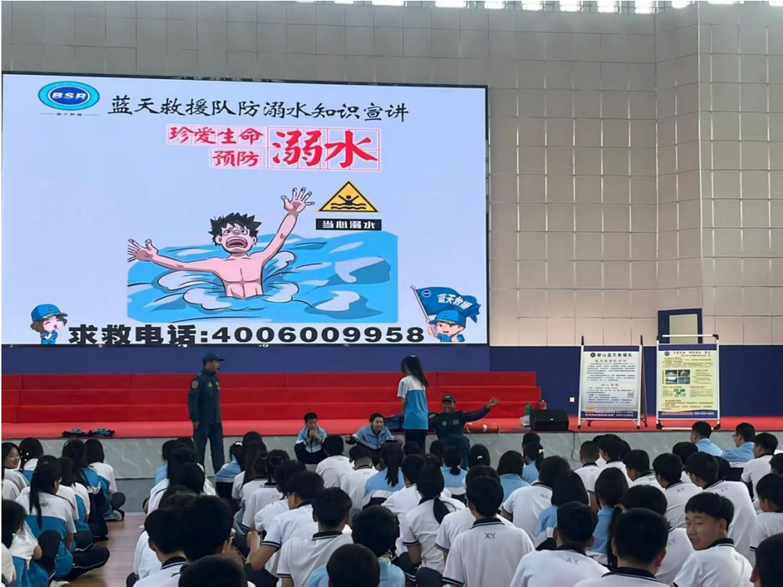
图 36 岫岩蓝天救援队防溺水知识宣讲现场

此次活动成效显著：一是以专业权威的现场指导极大增强了教育的说服力与警示效果；二是通过沉浸式实操使学生切实掌握了科学自救与施救的初步能力。该模式成功链接了社会专业资源，为各类学校开展具有实效性、吸引力的安全教育提供了可复制的实践范例，有效推动了安全教育从被动灌输向主动习得的转变。