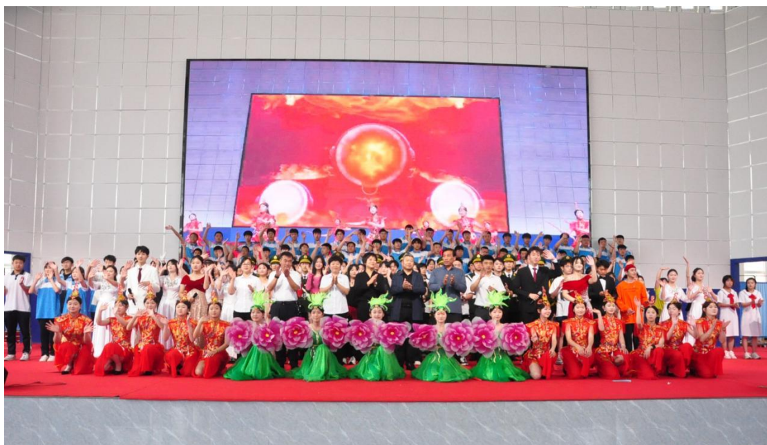
图 14 校园艺术节文艺演出