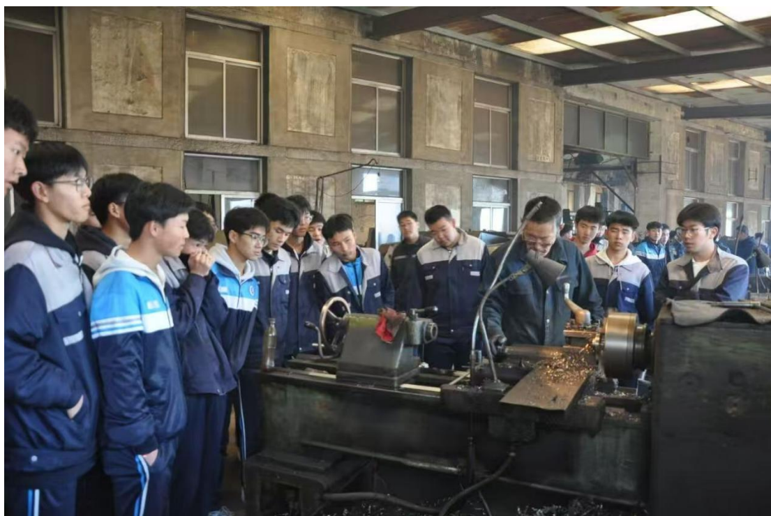
图 2 学生在鞍山骏达制冷设备有限公司认知实习

学校持续推进与本地优质企业的深度合作，巩固并拓展了与鞍山骏达制冷设备有限公司、鞍山翔龙制冷设备配件有限公司等企业的校外实习实训基地。这些基地为学生提供了直面生产一线、认知岗位流程、体验企业文化的宝贵机会，使专业认知实习和岗位实习得以在真实产业环境中开展，有效弥合了学校教学与企业生产之间的距离，夯实了学生实践能力培养的基础平台。