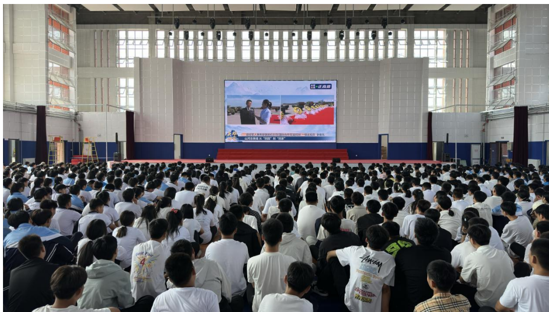
图 25 组织学生集中观看在韩烈士遗体回国直播