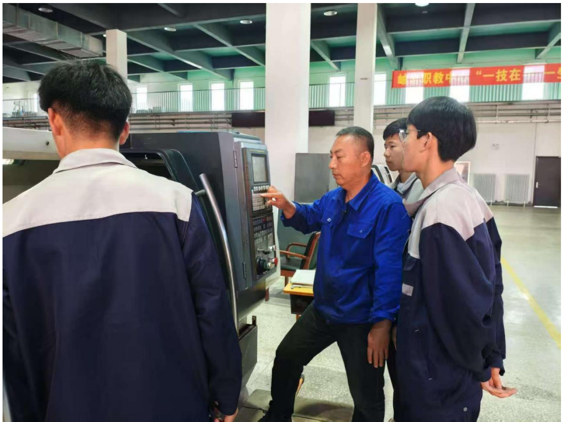
图 19 实训车间教师演示操作步骤