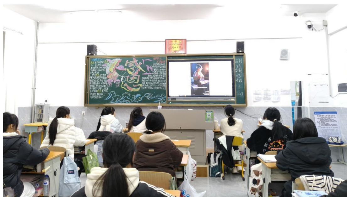
图 21 学习成语故事

化、常态化。每周日晚自习设为固定学习时段，由班主任引领，围绕“孝顺感恩”、“诚实守信”、“仁爱友善”、“励志勤学”等核心德育主题，分类别、分篇章组织学生学习相关成语的典故、释义及现实意义。学习过程强调“学懂、悟透、能讲”，通过诵读、解析、讨论和分享，确保知识内化。学期末举办“成语故事大赛”，通过讲述、演绎等方式，让学生在实践中深化对语言智慧与传统美德的体认，实现了文化知识传授与价值观念引导的有效融合。