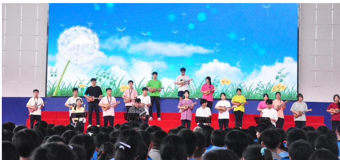
图 15 尤克里里社团演出