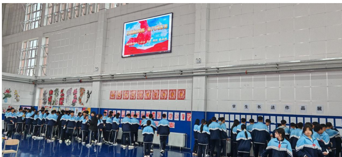
图 23 学生观看书法绘画艺术展