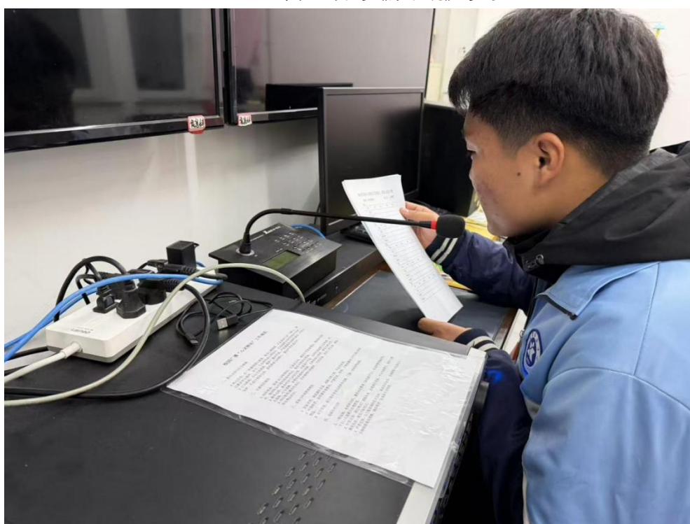
图 3 心灵驿站校园广播播音现场