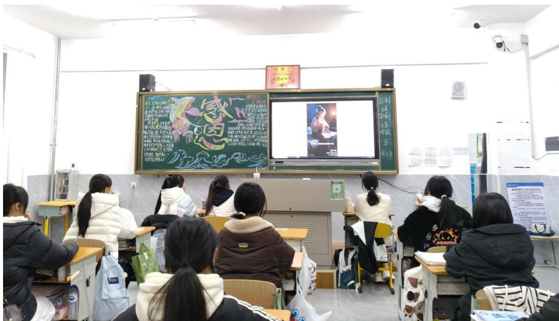
图 4 成语故事学习