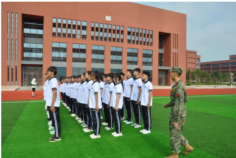
图 35 新生军训