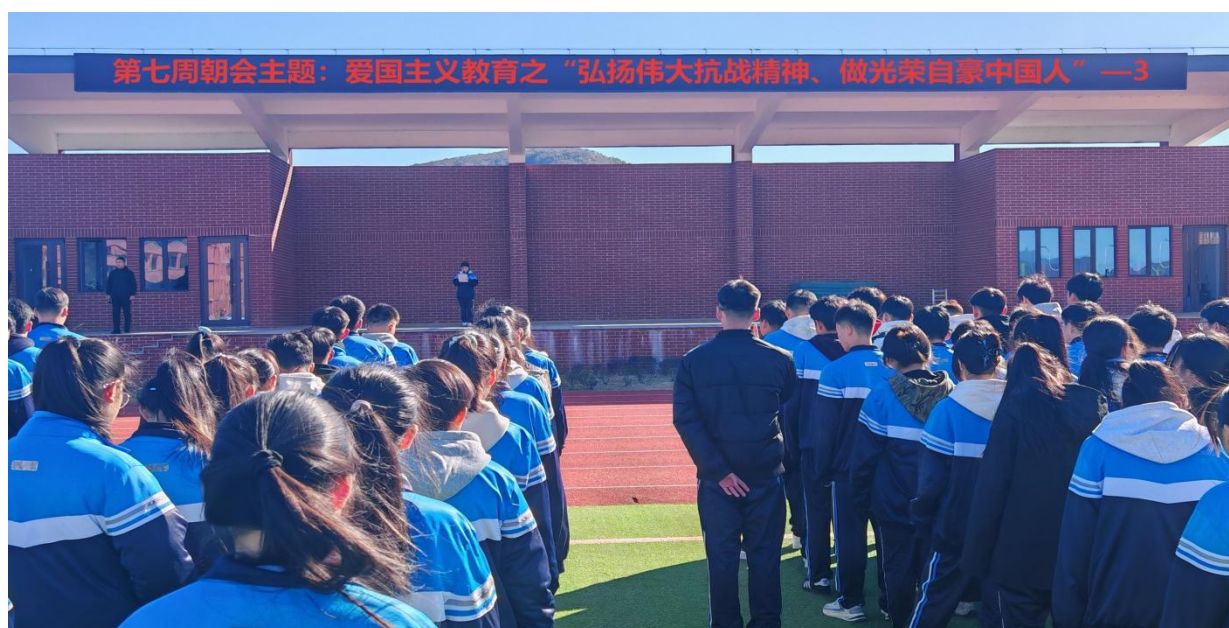
图 13 学生聆听国旗下演讲