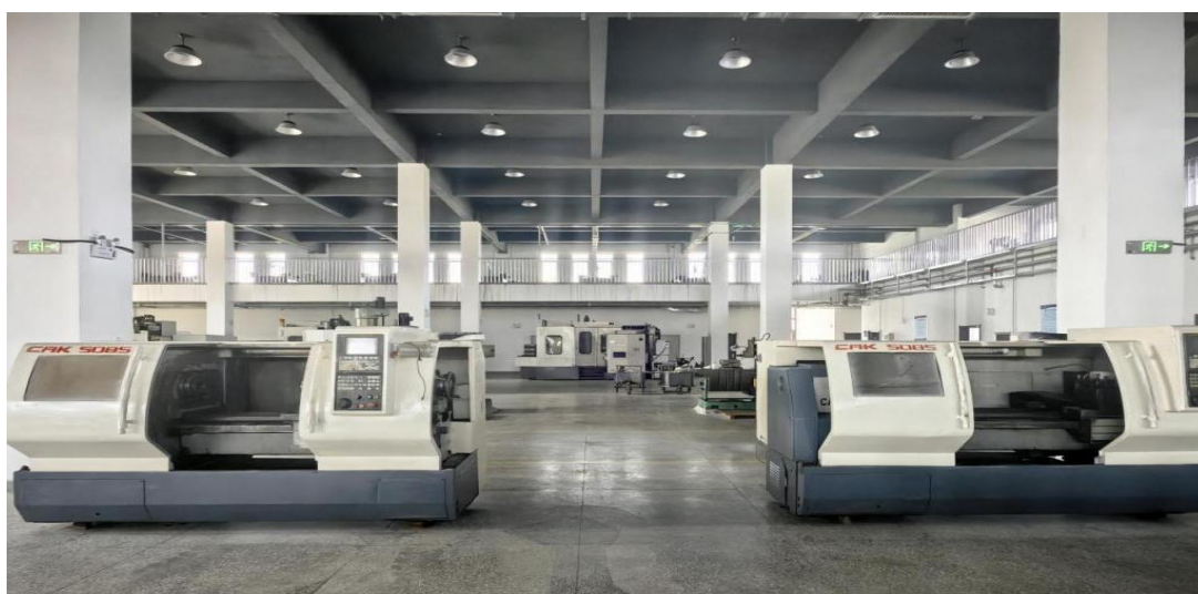
图 3 辽宁岫岩液压油缸有限公司捐赠设备

克 CA6150 数控车床，显著提升了学校在高端制造领域的实训装备水平。不仅如此，该公司还承诺并落实定期派遣企业高技能人才入校，直接参与学生的实践教学与技能指导。这种“设备+人才”的打包支持模式，不仅改善了硬件条件，更将企业最新的技术标准、工艺要求和工匠经验直接带入课堂，实现了产业资源向教学资源的有效转化，极大地增强了校内实训的先进性与实效性。