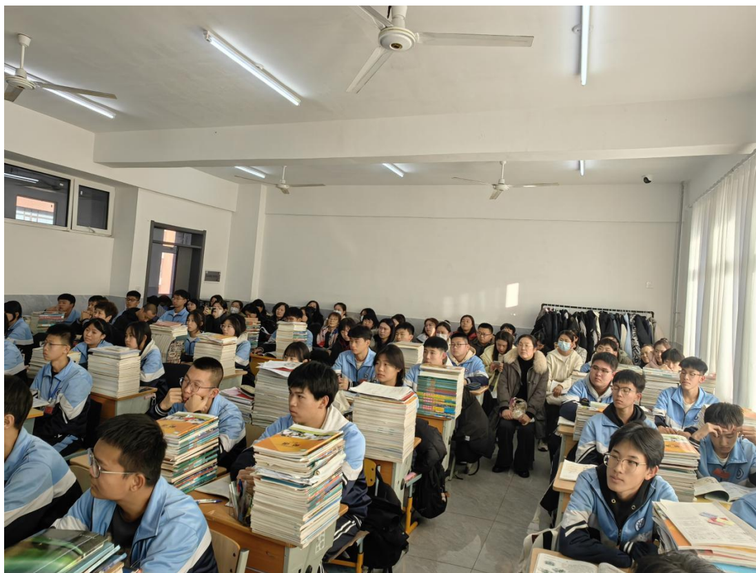
图 31 教职工听公开课

担当，更在全校范围内形成了良好的教学研讨与改革氛围，切实发挥了党员在提升教育教学质量中的先锋模范作用。