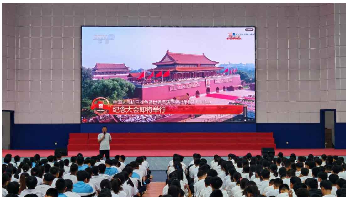
图 24 统一观看“九三”阅兵直播