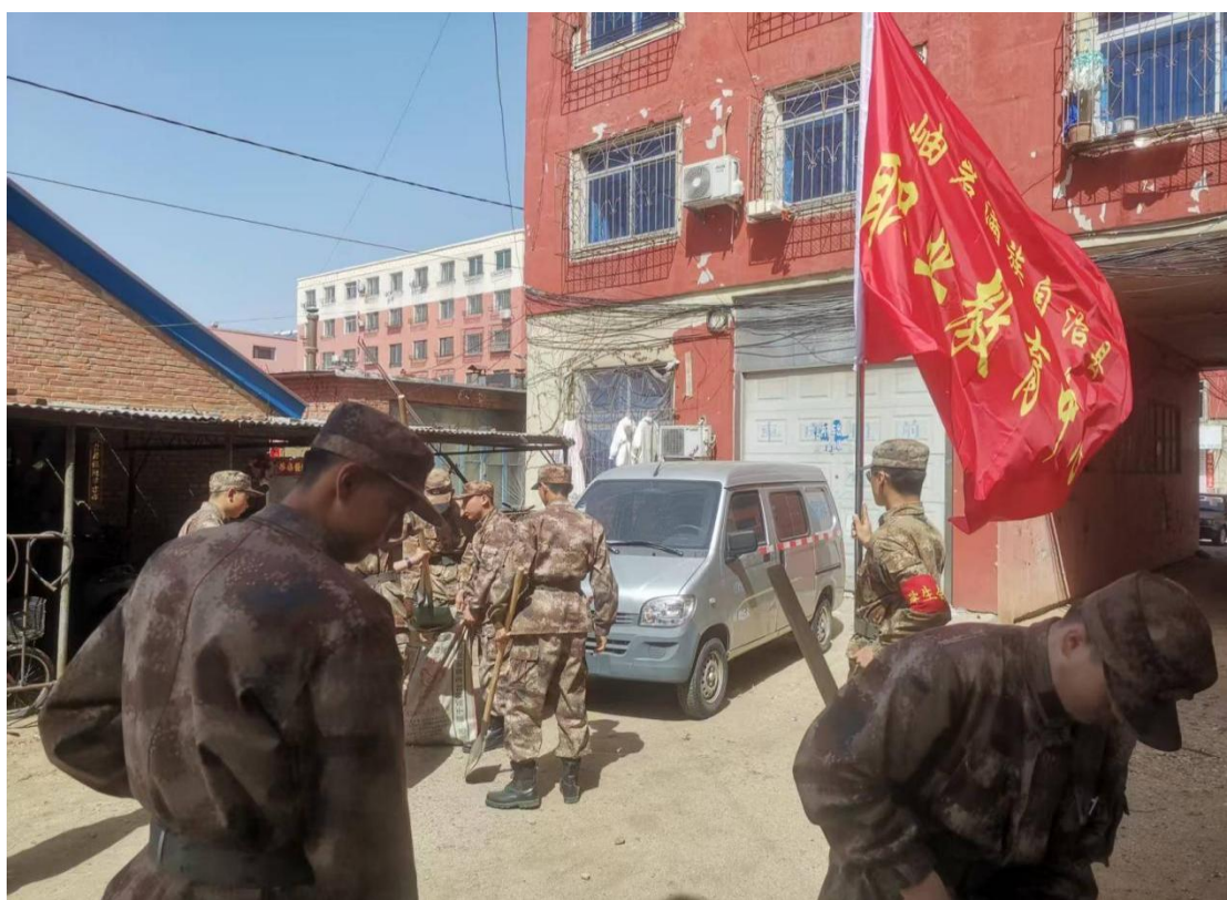
图 9 职教学子清扫社区卫生

结合学雷锋活动日、爱国卫生月等重要节点，定期组织学生志愿者队伍走出校园，深入周边社区街道、公园广场等公共区域，开展卫生清洁、垃圾分类宣传、城市“牛皮癣”清理等志愿服务活动。学生们在服务实践中，不仅美化了城市环境，更通过亲身参与，深化了对社会责任的理解，弘扬了奉献、友爱、互助、进步的志愿精神，以实际行动为创建文明城市、建设生态宜居的美丽岫岩贡献了青春力量。校内外相结合的环保实践，构建了全方位的环境教育体系，使绿色、低碳、可持续的生活方式深入人心。