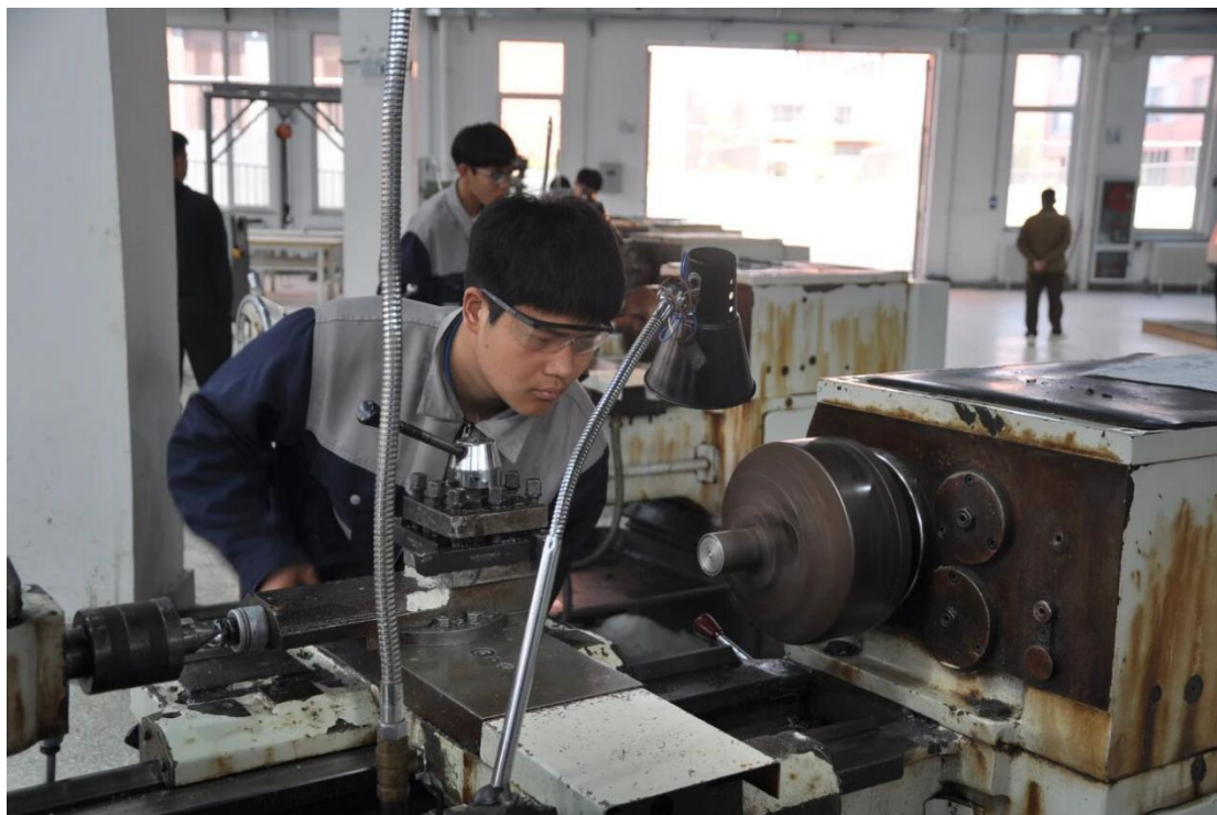
图 18 普通车床比赛现场