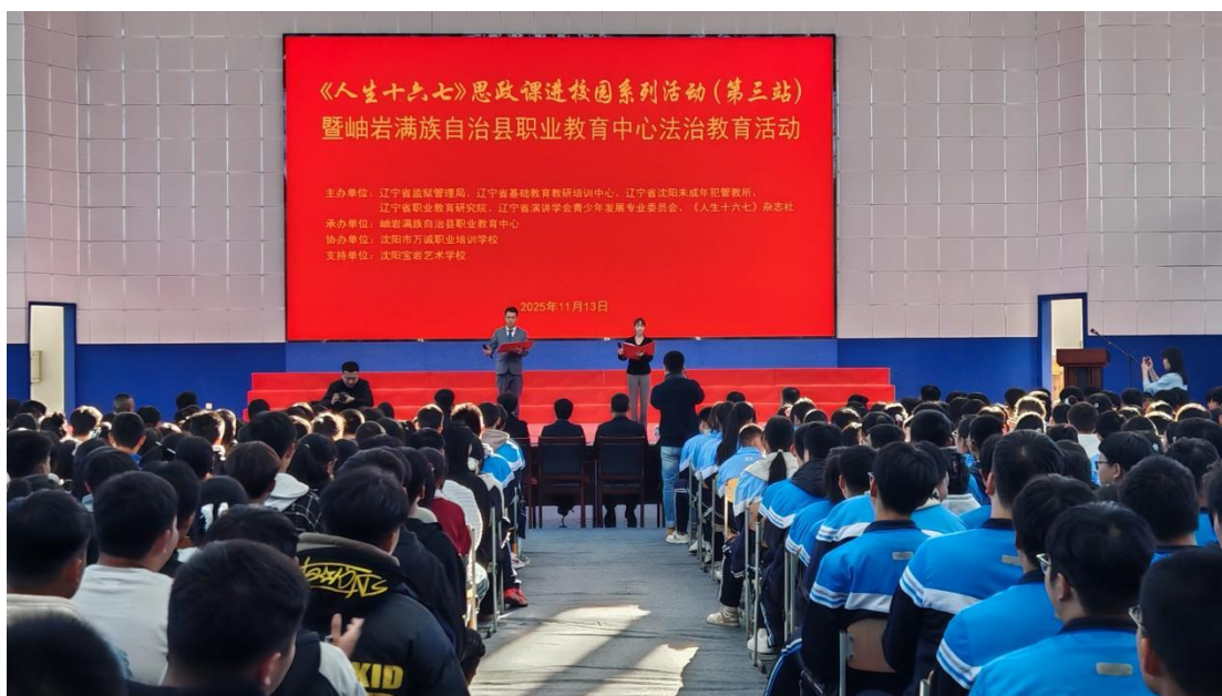
图 12 《人生十六七》法制思政课现场