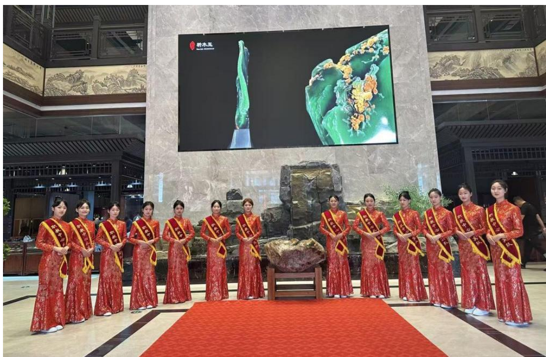
图 10 礼仪队在“玉星杯”玉石雕刻大赛现场