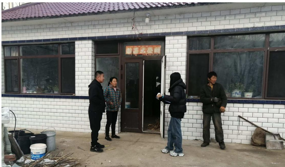
图 34 教师家访