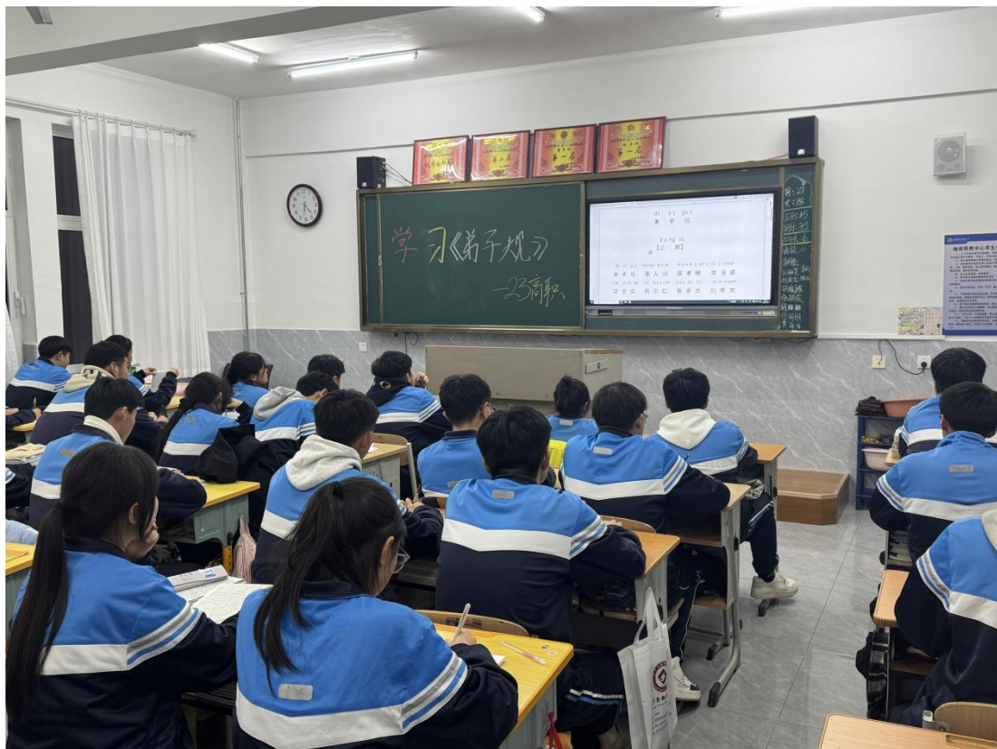
图 22 学习百句《弟子规》

传统礼仪规范与现代校园生活、实训纪律、岗位要求相对接，从而在潜移默化中提升学生的自律意识、责任观念和职业道德基础。