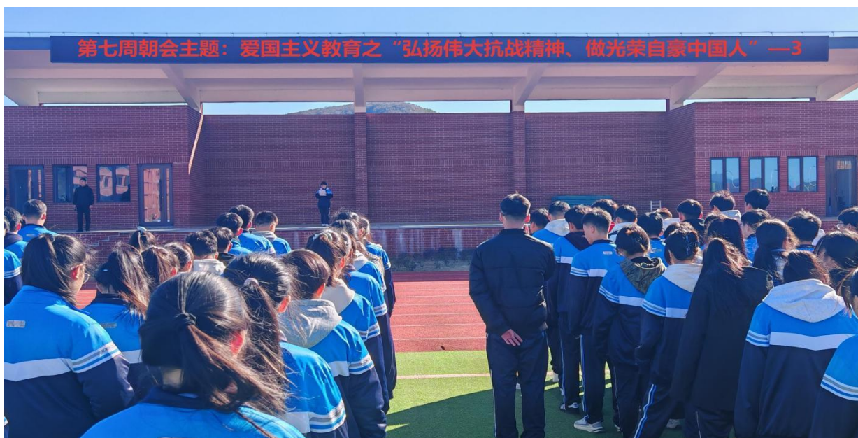
图 1 周一朝会国旗下演讲