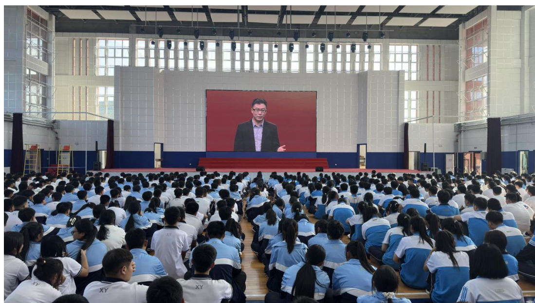
图 11 学生集体观看“全国中小学同上一堂思政大课”直播

观看学习，学生们对国家发展道路的理解更加深入，对自身所处的历史方位和时代使命有了更清晰的认识，有效强化了爱国主义情怀与社会主义理想信念，将个人成长自觉融入国家发展大局的意识得到显著增强。