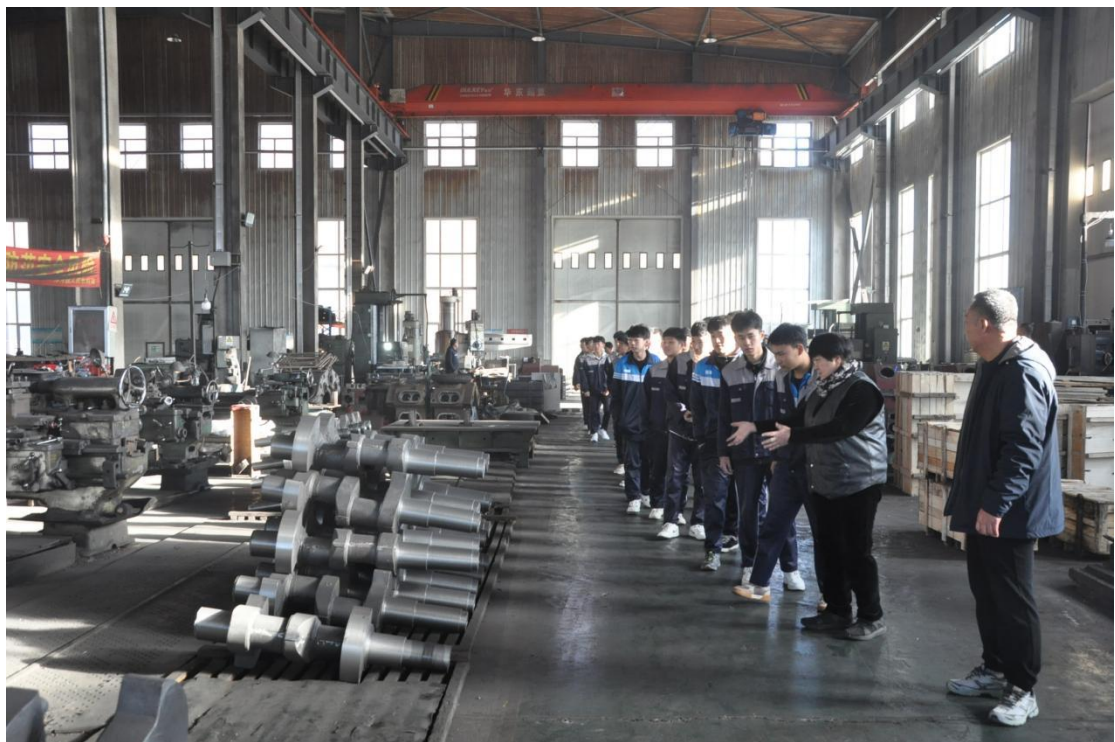
图 17 学生参观企业车间