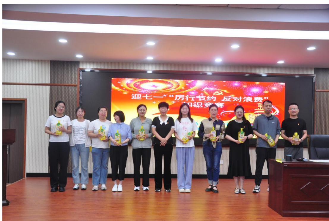
图 33 知识竞赛成绩优秀教师

活动成效显著：一是显著激发了党员自主学习、系统钻研党史党规的内生动力；二是通过集体竞技增强了党组织的凝聚力和党员的归属感；三是为基层党支部创新组织生活形式、提升党员教育管理吸引力提供了可复制范本。