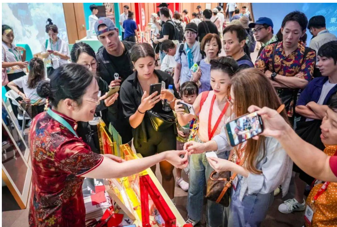
图 29 大阪世博会满族剪纸展区热闹景象