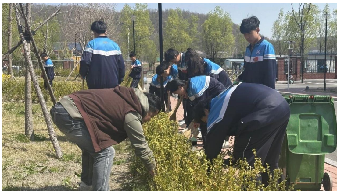
图 8 班主任带领学生清理校园绿化带

学校将营造优美、整洁、生态的校园环境作为基础性工程。针对洋河新校区校园面积广阔、绿化覆盖率高的特点，常态化组织学生参与环境卫生维护与绿化美化活动。学生们定期对教学楼、实训场所、公共区域进行清扫保洁，并积极参与户外绿化区域的杂草清理、树木养护及景观维护工作。这一过程不仅保持了校园环境的整洁优美，更在亲自动手的劳动实践中，有效增强了学生的环境保护意识、集体责任感和热爱劳动、珍惜劳动成果的品格。