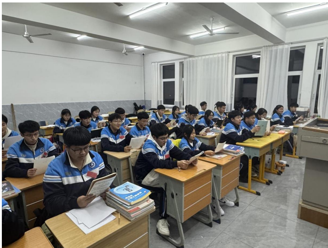
图 2 百句《弟子规》学习