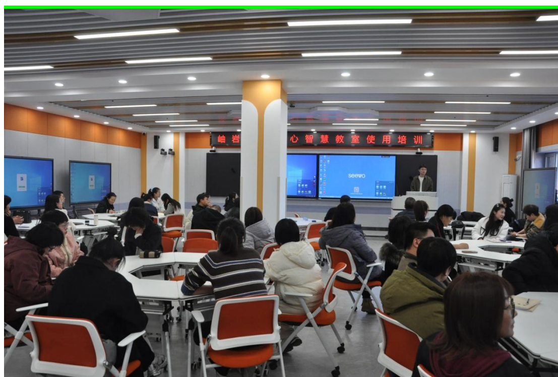
图 1 教师进行智慧教室使用和 AI 教学培训