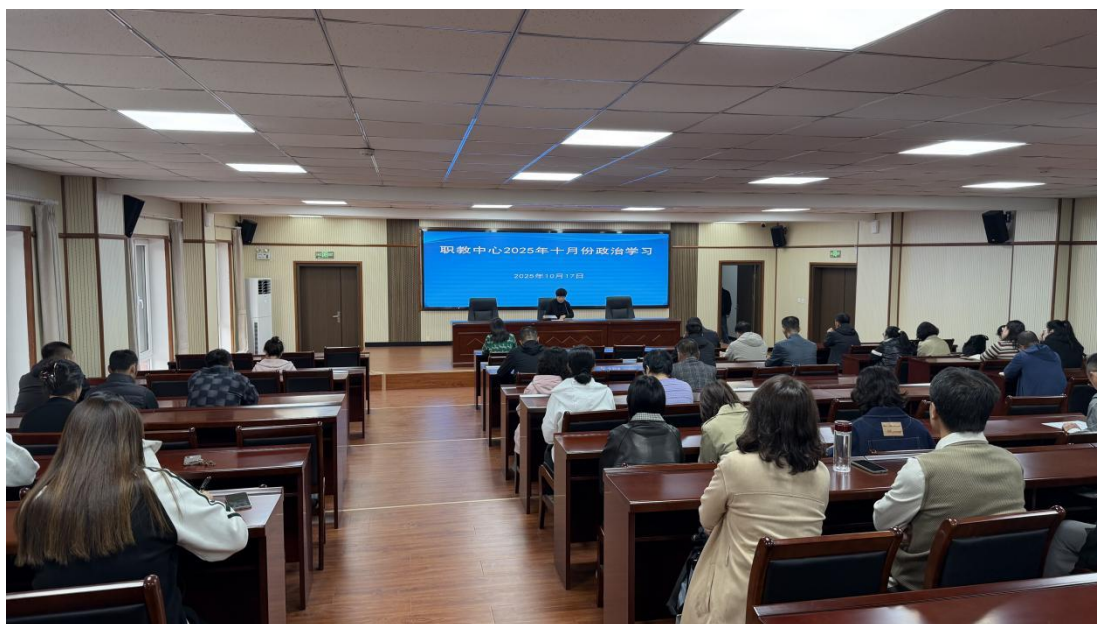
图 30 全校教职工政治学习

学校将提升教职工思想政治素养作为首要任务，建立健全常态化、制度化的政治理论学习机制。坚持每月定期组织全体教职工进行集体政治学习，系统学习党中央的最新政策精神、国家职业教育改革方案及重要法律法规，并要求全体人员认真撰写政治学习笔记，做到学有所思、学有所悟。此项工作有效统一了思想认识，强化了理论武装，为切实履行“为党育人、为国育才”的初心使命奠定了坚实的思想基础。