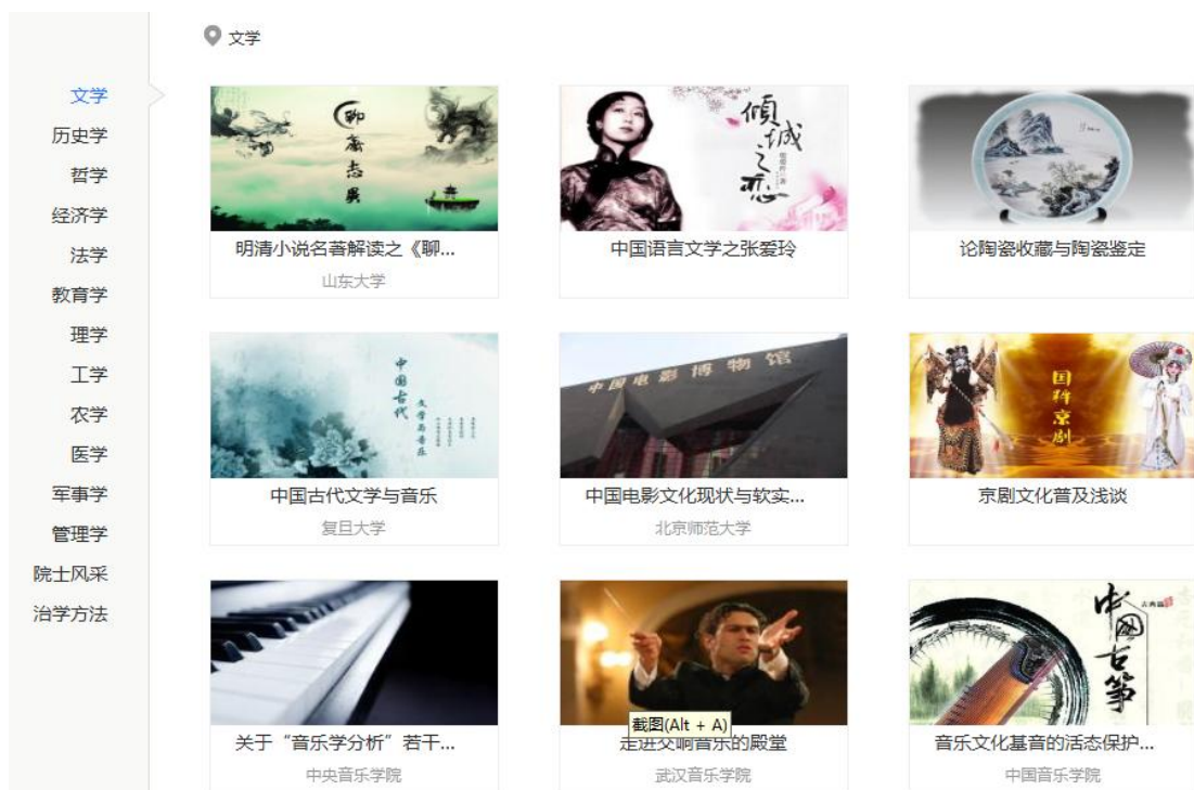
图 20 超星平台课程资源