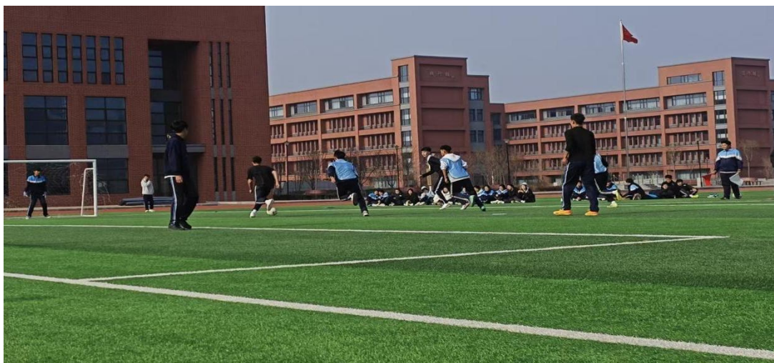
图 16 足球社团活动现场