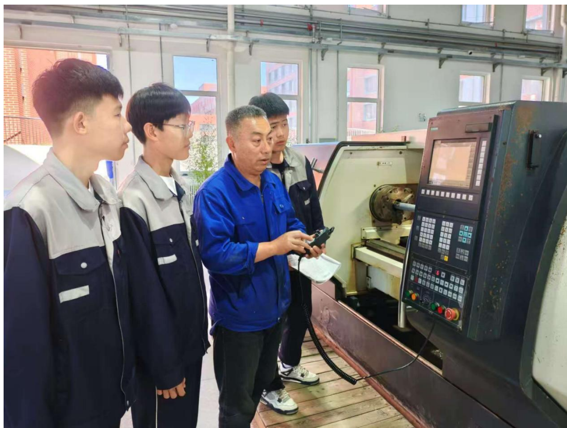
图 5 实训车间教师指导学生操作

多层次、全覆盖的实践教学与技能提升体系。一是以赛促学，激发精进动力。通过举办“一技在手·一生无忧”校级技能大赛等品牌赛事，设立普车、数控等赛项，让学生在真实任务挑战中锤炼从工艺设计到精密加工的全流程能力，展现精益求精的工匠追求。二是实训为本，筑牢技能根基。充分发挥校内实训车间作用，确保实践教学课时，推行“教学做一体化”模式，使学生在贴近生产实际的环境中反复操练，熟练掌握专业核心技能。三是中高衔接，拓宽成长通道。通过“3+2”等合作项目，与高职院校共建课程体系，为学生技能向更深、更精层次发展铺设道路。