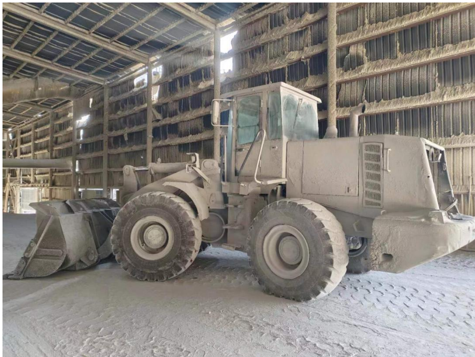
图三 肇事装载机（铲车）