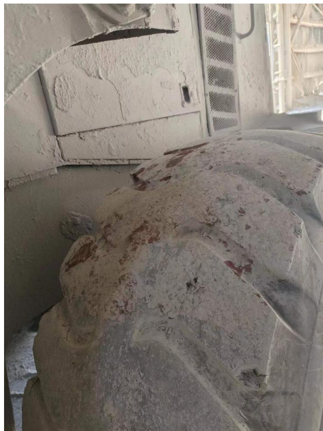
图四 肇事装载机（铲车）左后轮轮胎