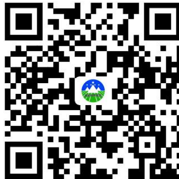
林草植物产地检疫证书核发

4.3 办理时限：材料要件齐全，4个工作日（依法需要听证、招标、拍卖、检验、检测、检疫、鉴定、专家评审、实地踏查、会议审议等所需时间不计算在审查期限内）。