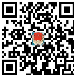
21.学历公证网上申请流程

http://spj.anshan.gov.cn/aszwdt/epointzwmhwz/pages/eventdetail/personaleventdetail?taskguid=23ff5066-12e6-43a3-8f07-d645faf79708&taskid=5eea5336-5839-42a7-b82d-c9d6c6b095e3