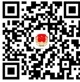
岫岩满族自治县司法局