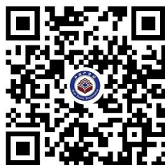
24.房屋等建筑物、构筑物所有权登记 (房地一体) --集体建设用地使用权及...