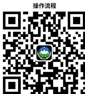
4.林木采伐许可证核发

http://spj.anshan.gov.cn/aszwdt/epointzwmhwz/pages/eventdetail/personaleventdetail?taskguid=2f35bda0-f9eb-4cdd-9ae0-b4b149a33588&taskid=f0704576-4038-4