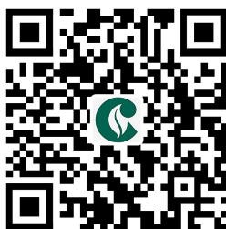
5.2烟草专卖零售许可证核发-停业