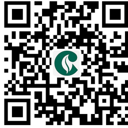
1.2烟草专卖零售许可证核发-新办