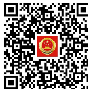
容缺办理事项清单