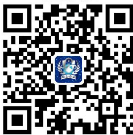
32.补领、换领第二代居民身份证

32.3 办理时限： 本市居民身份证制证周期为邮政速递证7个工作日、农村及其它偏远地区9个工作日投递到办证群众手中，普通邮寄证17个工作日邮寄到受理地公安机关；省内异地居民身份证制证周期为邮政速递15个工作日寄达省内市、县城区，普通邮寄30个工作日寄达受理地公安机关；跨省异地居民身份证制证周期为40天寄达受理地公安机关。