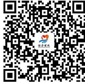
容缺办理事项清单