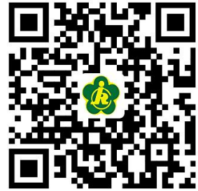
残联权力事项清单