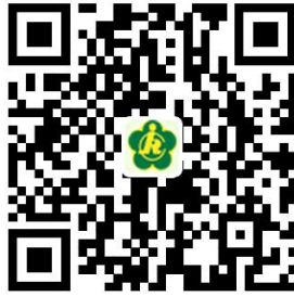
申请新办残疾人证