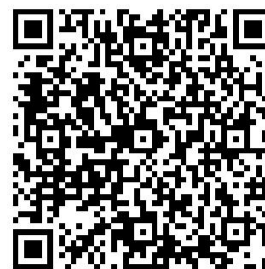
生态环境审批权力事项清单