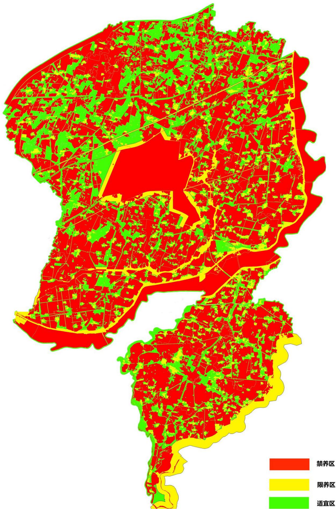
图 3-2 畜禽禁（限）养区布局图