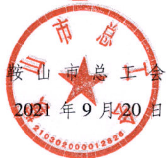
鞍山市总工会 2021年9月20日