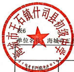
表6 单位名称：海城市王石镇什司县初级中学