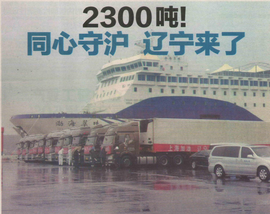
4月12日上午,68辆满载生活物资的货车在辽渔大连湾新港码头鱼贯驶入辽渔集团的大型轮渡,奔赴上海。