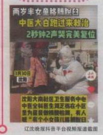
辽沈晚报抖音平台视频报道截图

两大白跑地人工呼吸施救，中疾控大白2秒窒息脱白，防疫队员女儿隔窗喊爹，他把卖毒车给防疫人员使用……在沈阳众志成城抗击新冠病毒的另一条战线上，本报记者用最快速度全面记录感人的“战疫”故事，为读者奉献了直击战疫最动人心的战疫全景画面。相助、抗疫必胜，仅抖音平台阅读量就过亿。