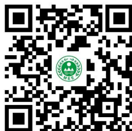
重点管理的排污单位核发