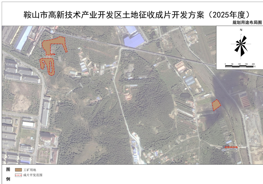
图 6 成片开发方案规划用途布局图