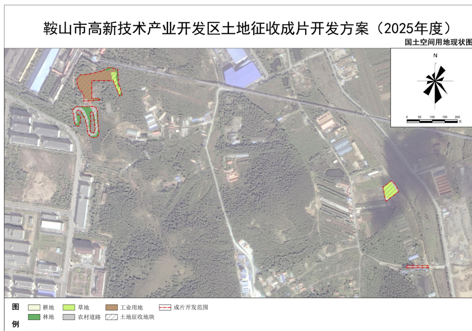
图 3 成片开发片区国土空间用地现状图