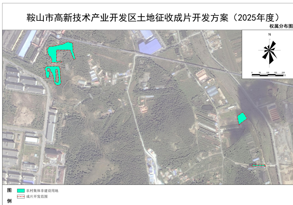
图 2 成片开发片区用地权属示意图

根据 2023 年度高新技术产业开发区国土变更调查数据，相关计划征地的地块，均已核实集体土地所有权数据库，且数据与省数据库内容一致。成片开发范围内，农用地 1.9506 公顷，占成片开发范围面积的 100%，工业用地为五矿临时用地，在 2023 年国土变更调查中调为工业用地，2023 年未纳入城镇村现状建设用地范围。