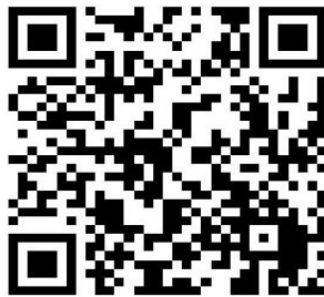
鞍山市政务服务网网上申报操作指南

http://spj.anshan.gov.cn/aszwdt/epointzwmhwz/pages/default/index