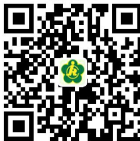
申请新办残疾人证