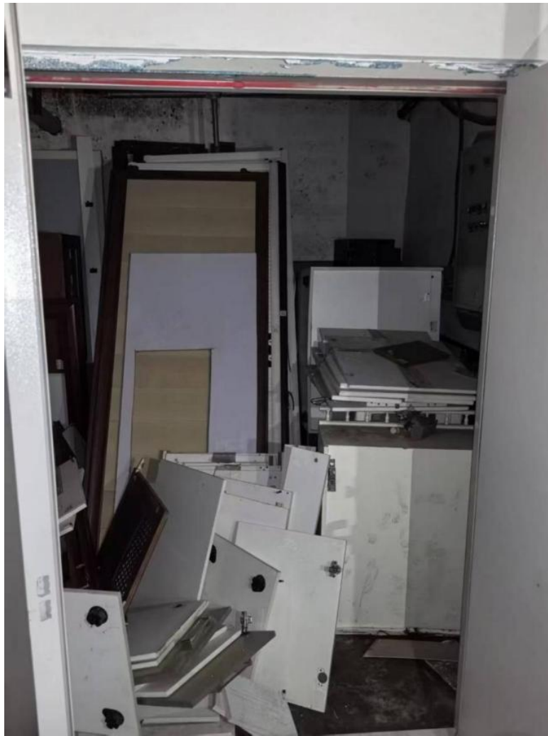
图3：起火建筑所在小区的消防控制室

315 栋南侧玛雅台球厅（该单位已停业）地下室内，消防控制室联动设备未安装完毕，联动设备未供电，火灾自动报警系统均处于瘫痪状态，墙壁消火栓无水，且未通过竣工验收。